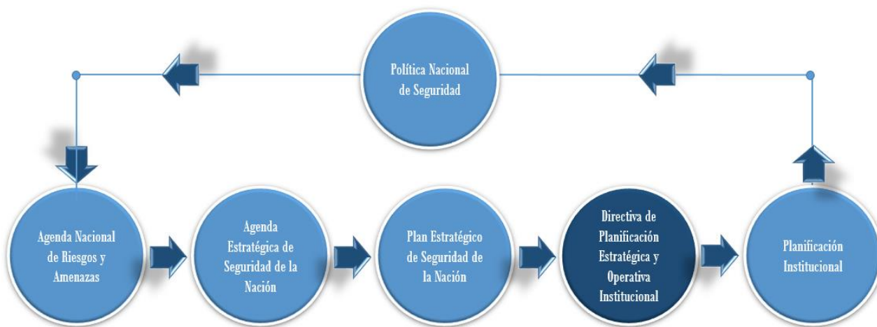
Gráfica 2. Elaboración CAP